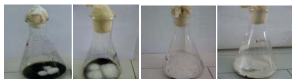
7j 15j 22j 30j Figure 1. Evolution de la biomasse fongique durant l'incubation

Cette croissance affecte le taux de la matière sèche du substrat, en effet, l'échantillon passe de 10g le jour d'incubation à 8,85 g le 30 ème j d'incubation.