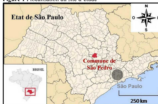
Figure 1 : localisation du site d'étude

Les agriculteurs de la vallée sont pour la plupart descendants de colons italiens venus se lancer dans la florissante exploitation du café au début du XXI e siècle. Les vastes domaines agricoles, alors exploités collectivement, ont été progressivement divisés et morcelés par héritages, menant aujourd'hui à des exploitations individuelles de taille réduite (7 à 60 ha). Parallèlement, la monoculture de café a laissé place à une agriculture plus